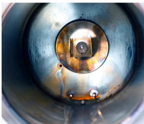
Senza pulizia regolare della camera